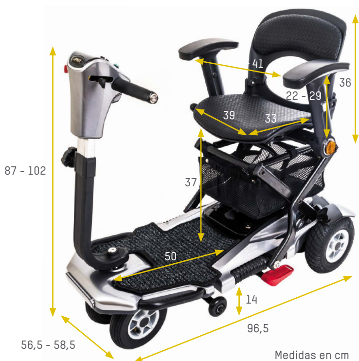
Medidas en cm